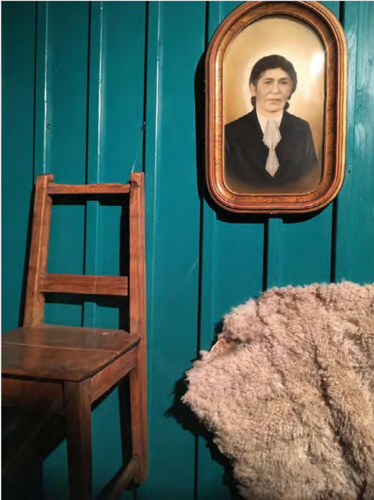
CONSTANZA PÉREZ LIRA WITHIN THE WALL , 2019 INSTALLATION.

The wall as a vertical element enclosing a determined space supports different significances according to who designs, builds, studies and lives it. Varied studies from the Academia analysing wall's typology can be found on the attempt of understand, register and define its composing and differentiating elements.