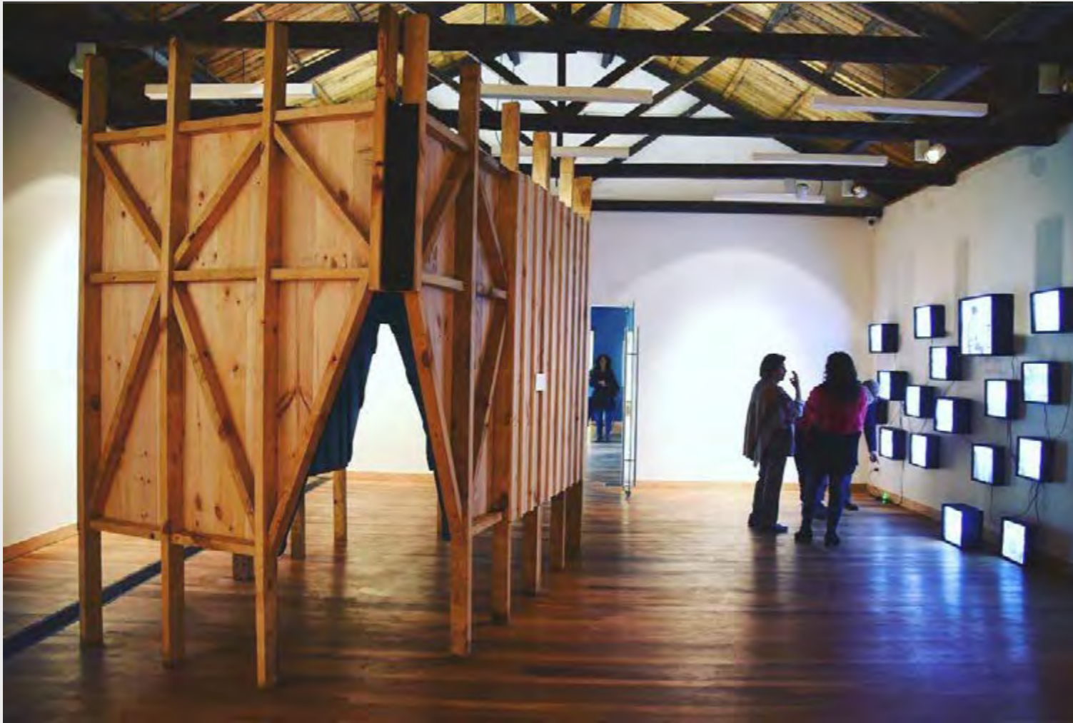
CONSTANZA PÉREZ LIRA WITHIN THE WALL , 2019 INSTALLATION.

The wall as a vertical element enclosing a determined space supports different significances according to who designs, builds, studies and lives it. Varied studies from the Academia analysing wall's typology can be found on the attempt of understand, register and define its composing and differentiating elements.