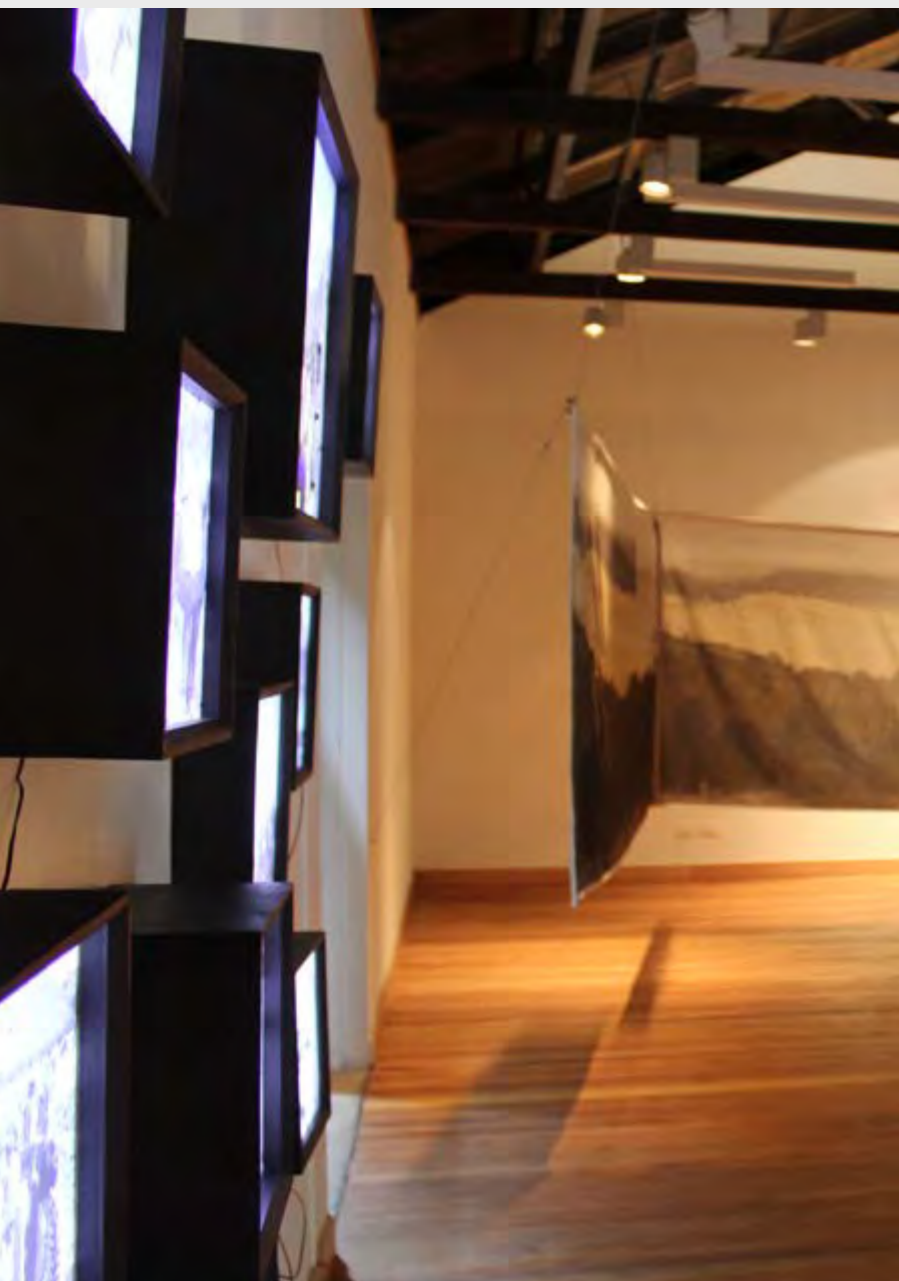
CARLOS CASTILLO LEVICOY ACTIVIDADES DEL CAMPO , 2019 FOTOGRAFÍA