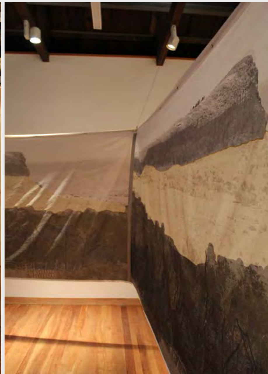
CONSTANZA PÉREZ LIRA WITHIN THE WALL , 2019 INSTALLATION.