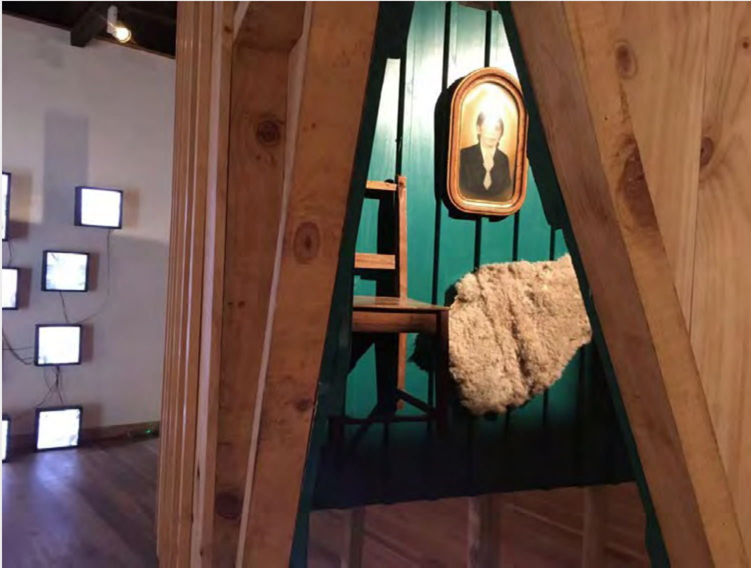
CONSTANZA PÉREZ LIRA WITHIN THE WALL , 2019 INSTALLATION.

The wall as a vertical element enclosing a determined space supports different significances according to who designs, builds, studies and lives it. Varied studies from the Academia analysing wall's typology can be found on the attempt of understand, register and define its composing and differentiating elements.