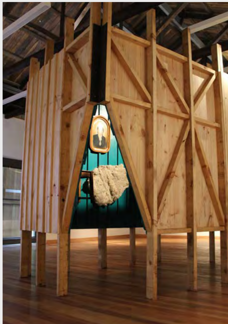
CONSTANZA PÉREZ LIRA MURO ADENTRO , 2019 INSTALACIÓN