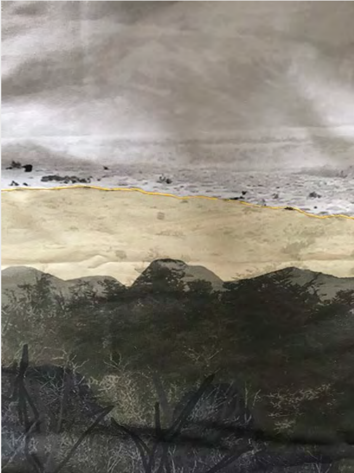
FRANCISCA TERRAZAS LAGOS MEMORIAS DE PAISAJE , 2019 GRABADO DIGITAL SOBRE TELA.

Se habla del exterior, del paisaje que pasa a ser intervenido por el ser humano, quien va dejando su huella