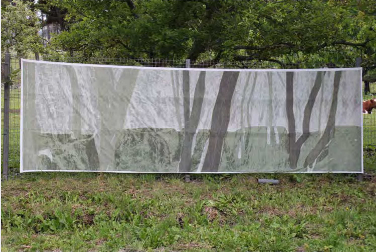
FRANCISCA TERRAZAS LAGOS MEMORIAS DE PAISAJE , 2019 GRABADO DIGITAL SOBRE TELA.

Se habla del exterior, del paisaje que pasa a ser intervenido por el ser humano, quien va dejando su huella