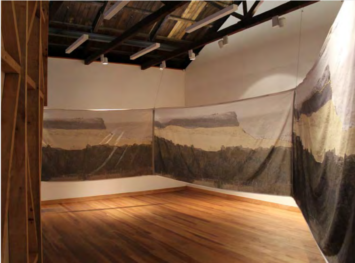
FRANCISCA TERRAZAS LAGOS MEMORIAS DE PAISAJE , 2019 GRABADO DIGITAL SOBRE TELA.

Se habla del exterior, del paisaje que pasa a ser intervenido por el ser humano, quien va dejando su huella