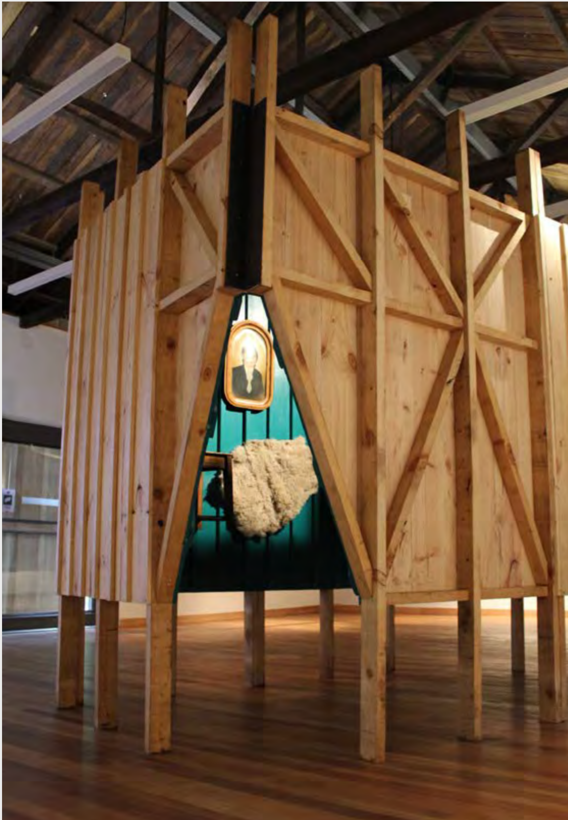
CONSTANZA PÉREZ LIRA WITHIN THE WALL , 2019 INSTALLATION.

The wall as a vertical element enclosing a determined space supports different significances according to who designs, builds, studies and lives it. Varied studies from the Academia analysing wall's typology can be found on the attempt of understand, register and define its composing and differentiating elements.