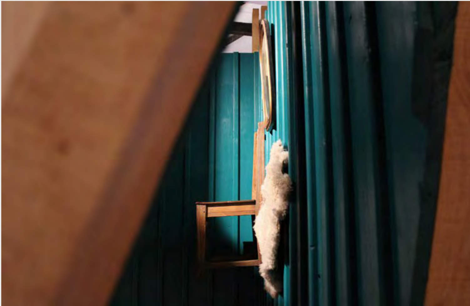
CONSTANZA PÉREZ LIRA WITHIN THE WALL , 2019 INSTALLATION.

The wall as a vertical element enclosing a determined space supports different significances according to who designs, builds, studies and lives it. Varied studies from the Academia analysing wall's typology can be found on the attempt of understand, register and define its composing and differentiating elements.