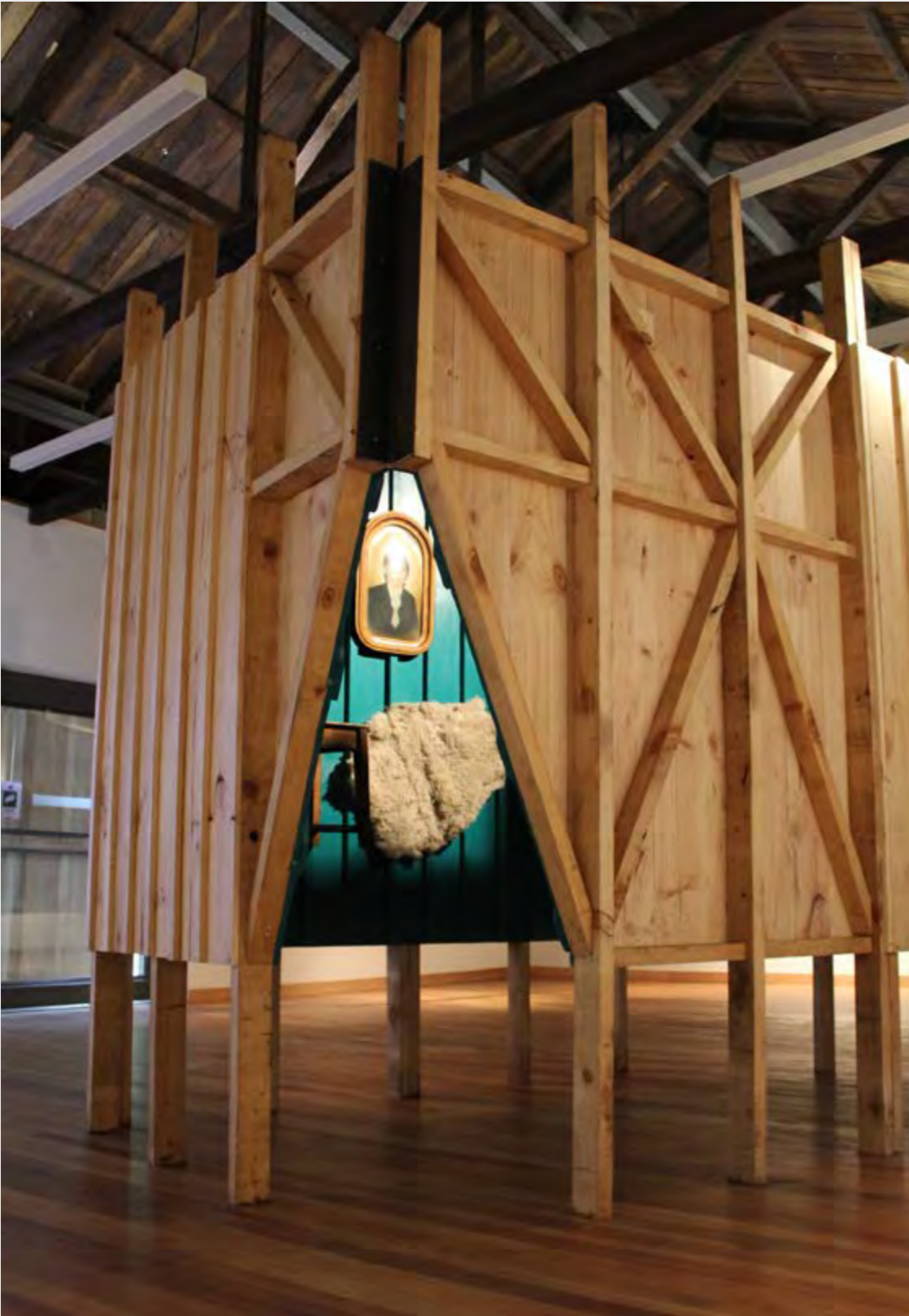
CONSTANZA PÉREZ LIRA MURO ADENTRO , 2019 INSTALACIÓN

El muro como elemento vertical que encierra un espacio determinado, mantiene diferentes significaciones según quien lo diseña, lo construye, lo estudia y lo vive. Desde el mundo académico, podemos encontrar variados estudios que analizan las diferentes tipologías de muro, en un intento por comprender, documentar y definir aquellos elementos que lo componen y lo diferencian de otros en su tipo.