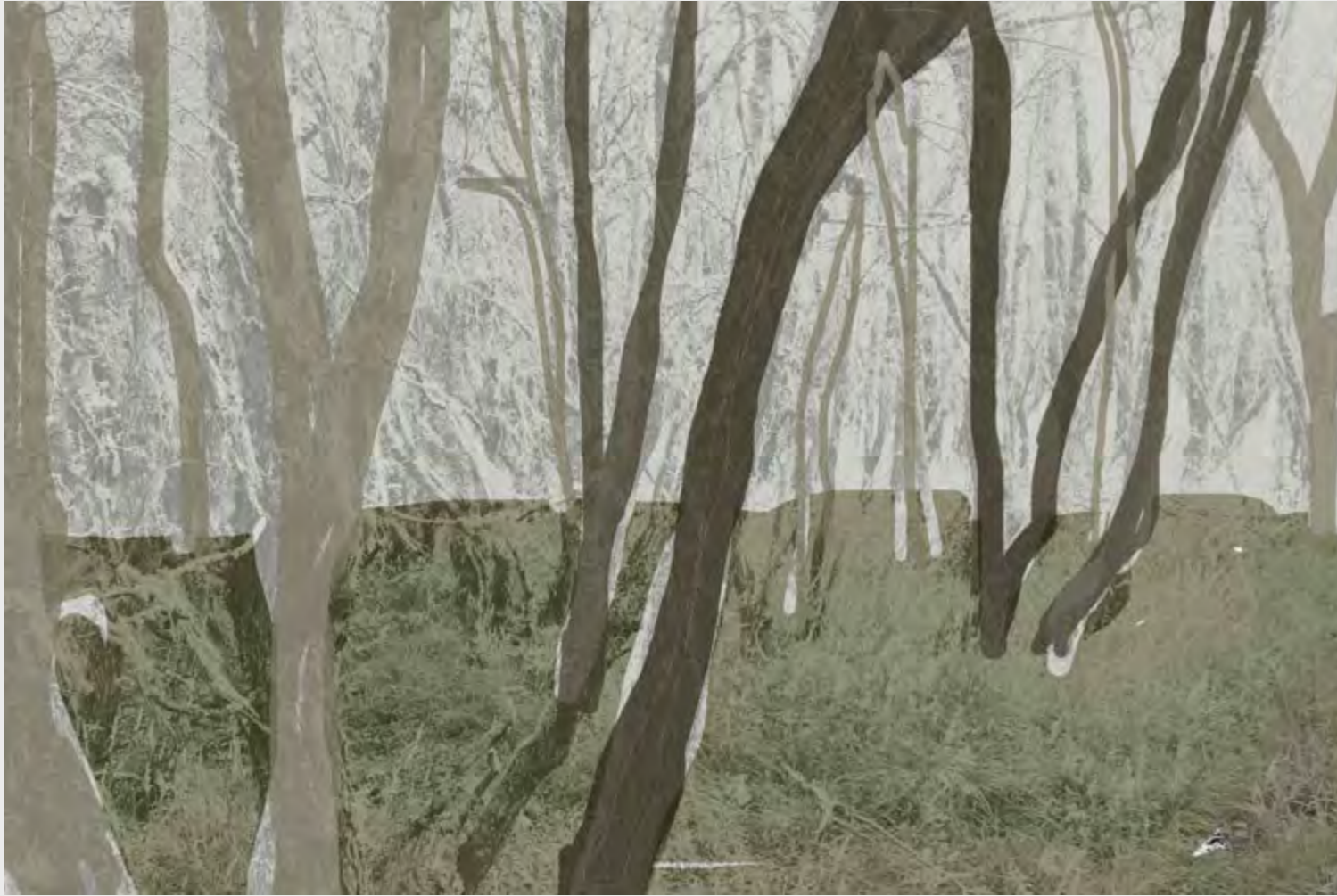
FRANCISCA TERRAZAS LAGOS MEMORIAS DE PAISAJE , 2019 GRABADO DIGITAL SOBRE TELA.

Se habla del exterior, del paisaje que pasa a ser intervenido por el ser humano, quien va dejando su huella