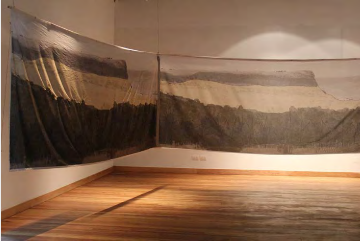
FRANCISCA TERRAZAS LAGOS MEMORIAS DE PAISAJE , 2019 GRABADO DIGITAL SOBRE TELA.

Se habla del exterior, del paisaje que pasa a ser intervenido por el ser humano, quien va dejando su huella