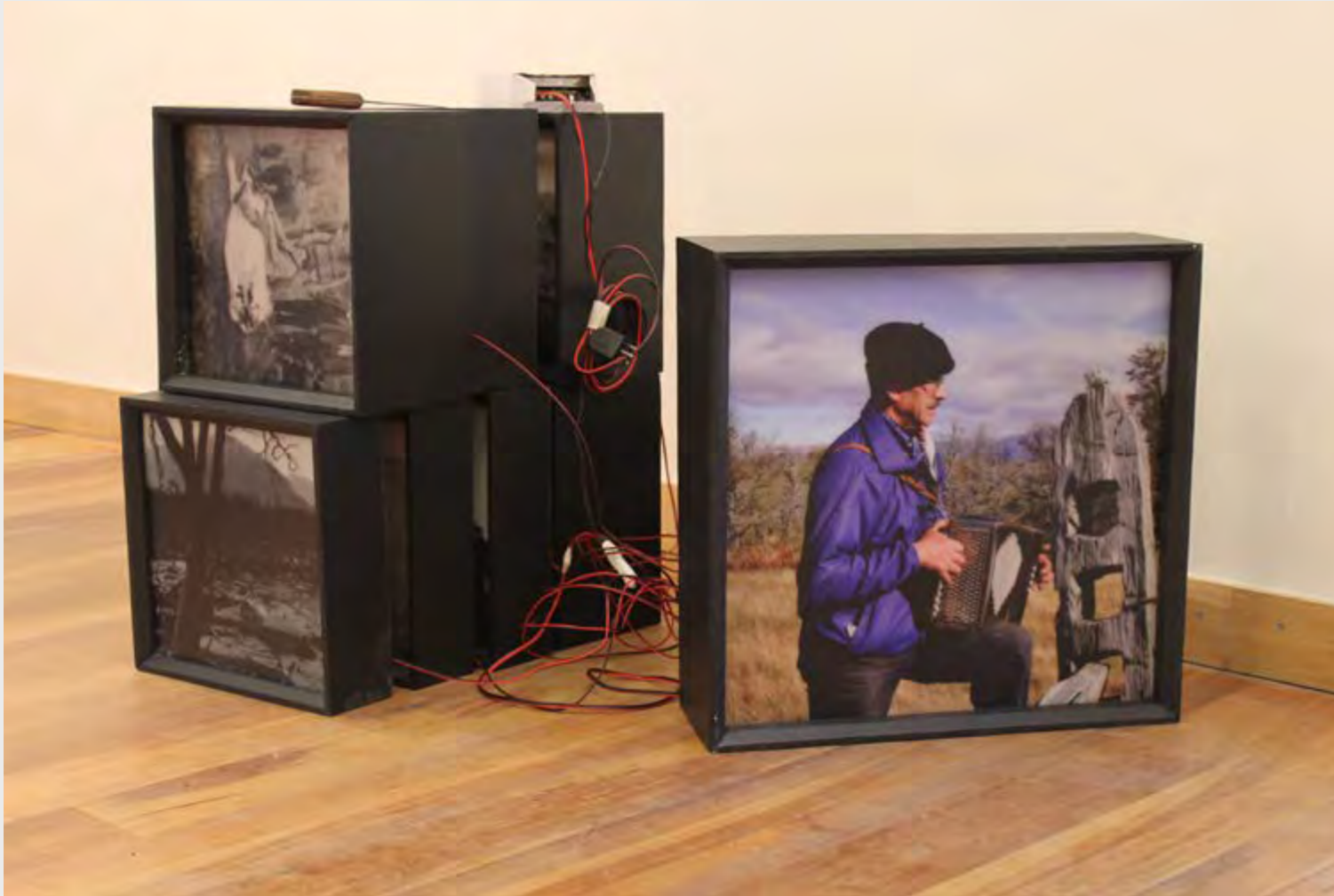
CARLOS CASTILLO LEVICOY ACTIVIDADES DEL CAMPO , 2019 FOTOGRAFÍA

Vida cotidiana y elementos representativos; al preguntarnos cómo vemos el hábitat de este territorio reflexionamos sobre las experiencias de vida de aquellos pobladores/as que aferrados a un ideal de vida han logrado dejar huellas que perduran. El análisis, la observación de imágenes, objetos y palabras, se mezclan con aquello que no solamente se ha visto sino también se ha comprendido. La importancia de ver y experimentar a través de una iniciativa como Vernácula Aysén, merece una atención particular para revisar el trabajo investigativo que ha sido levantado en estos territorios junto a sus personas y entorno natural. Ver y experimentar, crea a partir de la voz de los propios artistas, nuevas lecturas que exhiben lo que se ve y se percibe, tanto desde un punto de vista conceptual como desde el propio comportamiento artístico. Ésto puede hacer posible la realización de un determinado proyecto-acción que muestre las actuales formas de hacer e investigar para que finalmente le entreguen un valor a los elementos del pasado como pilares fundamentales de una identidad propia y única.