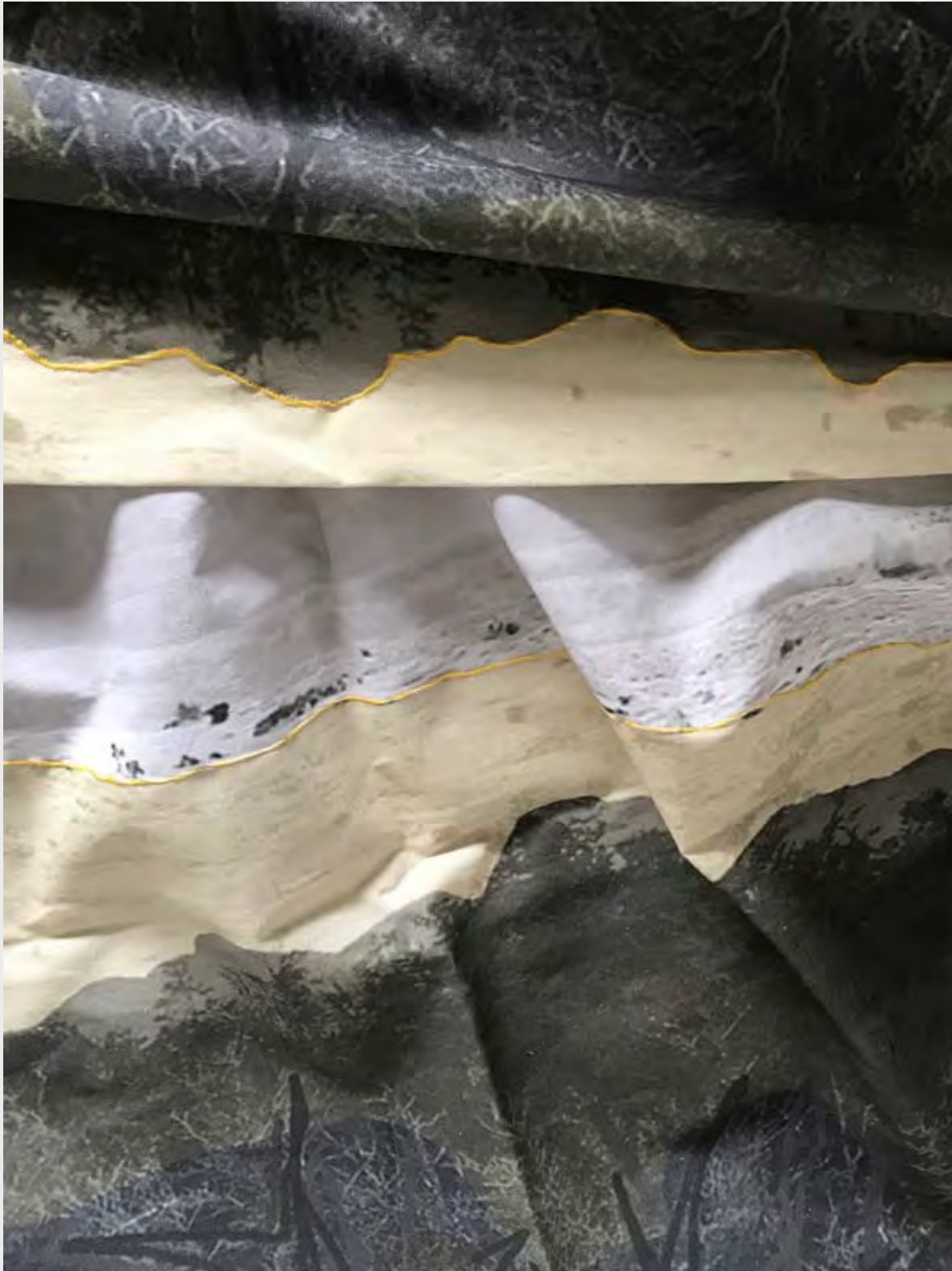
FRANCISCA TERRAZAS LAGOS MEMORIAS DE PAISAJE , 2019 GRABADO DIGITAL SOBRE TELA.

Se habla del exterior, del paisaje que pasa a ser intervenido por el ser humano, quien va dejando su huella