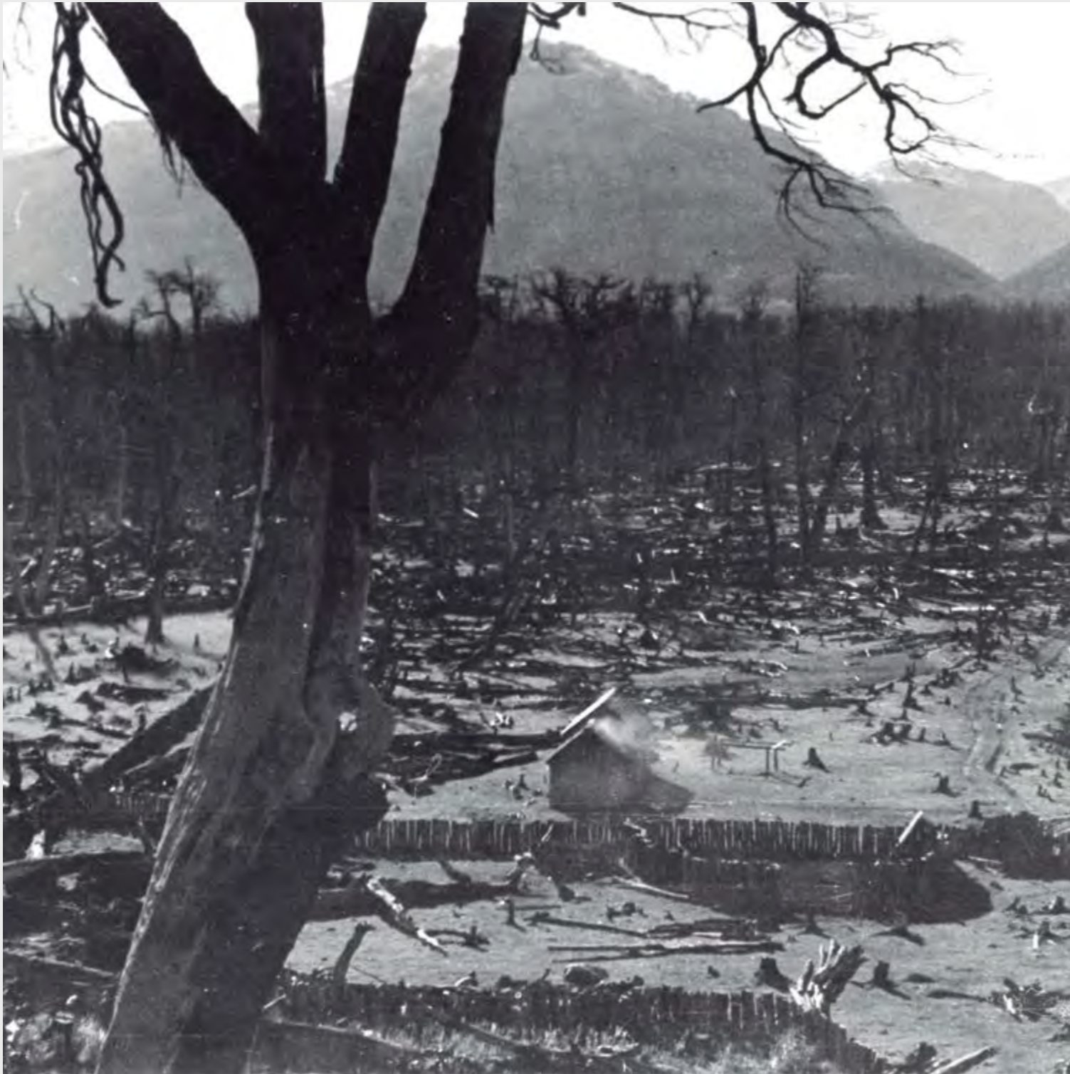
CARLOS CASTILLO LEVICOY ACTIVIDADES DEL CAMPO , 2019 FOTOGRAFÍA

Vida cotidiana y elementos representativos; al preguntarnos cómo vemos el hábitat de este territorio reflexionamos sobre las experiencias de vida de aquellos pobladores/as que aferrados a un ideal de vida han logrado dejar huellas que perduran. El análisis, la observación de imágenes, objetos y palabras, se mezclan con aquello que no solamente se ha visto sino también se ha comprendido. La importancia de ver y experimentar a través de una iniciativa como Vernácula Aysén, merece una atención particular para revisar el trabajo investigativo que ha sido levantado en estos territorios junto a sus personas y entorno natural. Ver y experimentar, crea a partir de la voz de los propios artistas, nuevas lecturas que exhiben lo que se ve y se percibe, tanto desde un punto de vista conceptual como desde el propio comportamiento artístico. Ésto puede hacer posible la realización de un determinado proyecto-acción que muestre las actuales formas de hacer e investigar para que finalmente le entreguen un valor a los elementos del pasado como pilares fundamentales de una identidad propia y única.