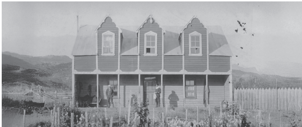
Casa de administración antigua del lote Ñirehuao de la Sociedad Industrial del Aysén (S.I.A.), c. 1915. Ñirehuao, comuna de Coyhaique, región de Aysén.

“Aysén es un paisaje humano de lo pequeño, de aquellas pertenencias que se podían traer en barco. Si se trataba de internarse hacia la cordillera, las posesiones estaban limitadas a lo que puede cargar una carreta: quizás una cocina a leña o a lo mas una piedra de molino, compartida con vecinos a varios kilómetros a la redonda” (Francisco Mena, 1992)