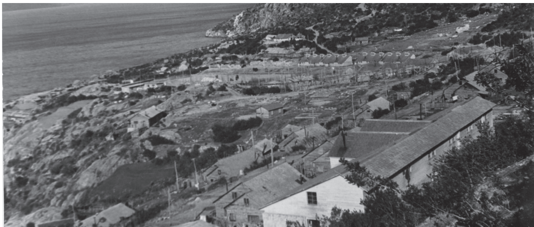
Vista panorámica de Puerto Cristal, 1965. Puerto Cristal, comuna de Río Ibáñez, región de Aysén.

“Las difíciles expediciones desde y hacia los “boliches” y centros poblados han ofrecido una coyuntura particularmente propicia para esta contienda amable e inconsciente por prestigio e influencia. Más que en cualquier otra circunstancia, aquí se pone periódicamente en la balanza el valor, la generosidad y las habilidades de los jefes de familia. La capacidad de coordinar una tropa de ‘pilcheros’ o caballos cargueros es prueba de persuasión y motivo de reconocimiento. La habilidad de construir una embarcación o coordinar un grupo para una navegación de ocho días a remo a través del lago General Carrera. La destreza en el manejo de la tropa, la habilidad del guitarrero, el truquero, el mentiroso o el cebador de mate durante las frías noches junto al fogón, allá en la huella” (Francisco Mena, 1992)