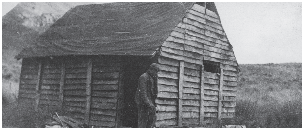
Hombre no identificado frente al puesto dieciocho en Río Chacabuco, 1919. Río Chacabuco, comuna de Cochrane, región de Aysén.

“Su modo de ser se ha definido en el enfrentamiento cotidiano al medio natural, no en relación a otros grupos humanos. Su cultura ha consistido en sobrevivir, sin necesidad de definir una identidad consciente de si misma ni desplegarla en símbolos estereotipados. Aunque no nos demos cuenta, Aysén ante nada una experiencia humana única” (Francisco Mena, 1992)